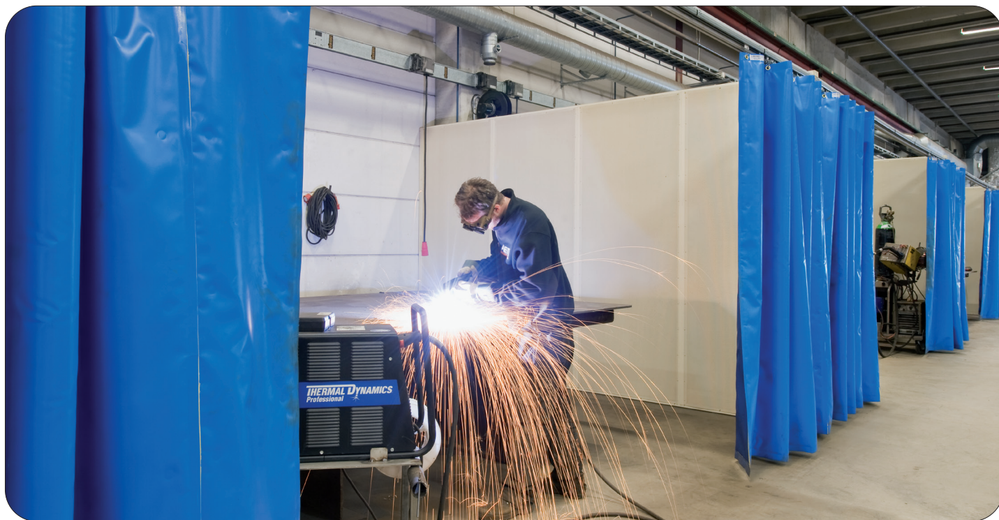
A10 bullerdraperi Blå

A10 har en bullerreducering på upp till 10 dB dvs. halvering av bullret. Påverkande av detta är hur ljudspegeln ser ut samt att den reducerar lite olika frekvenser mot A50 och A20. Den är mjuk och går att vika/ rulla ihop vilken gör den lättare att packa o fraktas i stora storlekar.