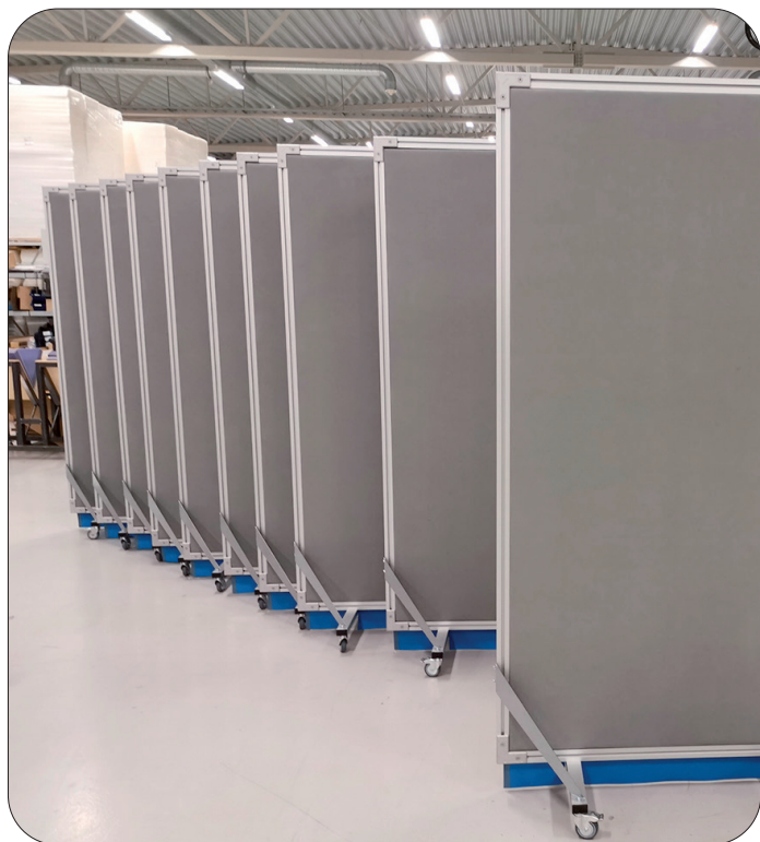
Bullerskärm Kraftig på hjul

Våra bullerskärmar Smidig och Kraftig på hjul används vid tillfälliga och/eller mindre bullriga arbetsplatser. De monteras på hjul och är lätta att flytta på. Två av hjulen är låsbara. Kärnmaterialet består av en A20/A50 skiva. Finns i färgerna Grått och Blått samt i några särskilda standardstorlekar.