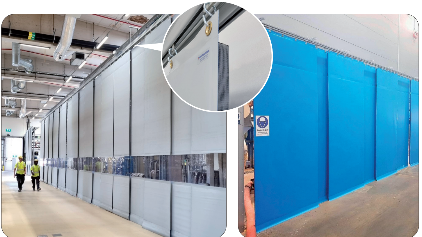
A50 bullerskivor med siktfält som används som skjutdörrar.

Nedan syns några exempel på A50 skivor som skjutdörrar.