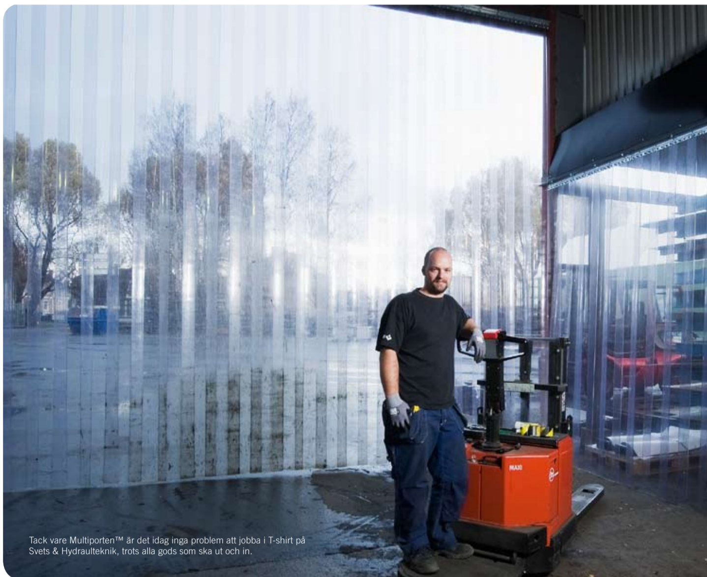
Tack vare Multiporten™ är det idag inga problem att jobba i T-shirt på Svets & Hydraulteknik, trots alla gods som ska ut och in.