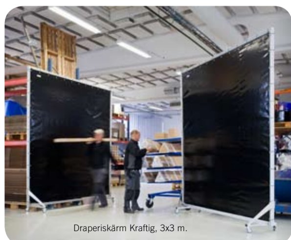
Draperiskärm Kraftig, 3x3 m.